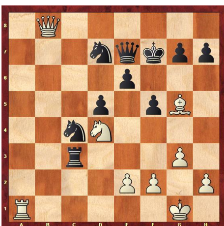
A. Giri-V. Kramnik, MastersR2 2752 2787