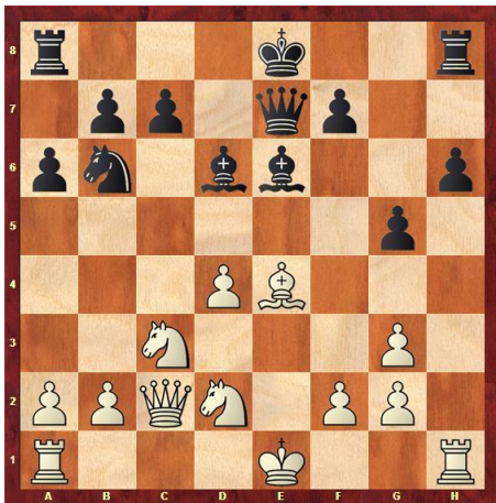
S. Karjakin-F. Caruana, MastersR7 2753 2811