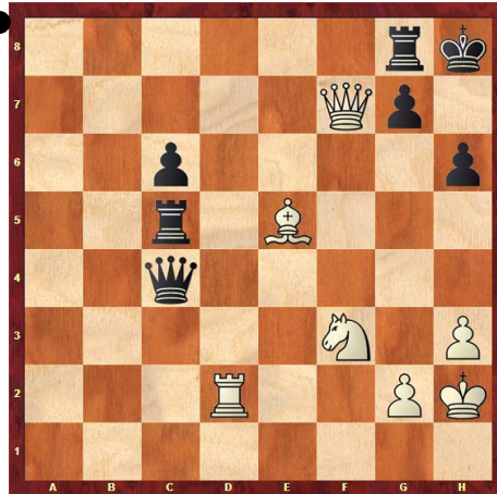
V. Anand-F. Caruana, MastersR3 2767 2811