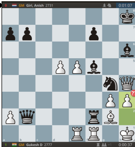
Alles hangt, dus zwart moet snel zijn!