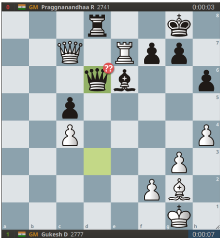
Wit wint materiaal