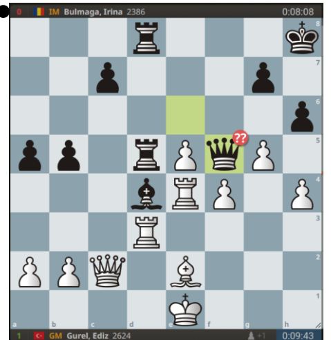
Beide dames staan nu ongedekt...