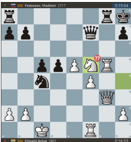
Welke witte stukken staan niet fijn?