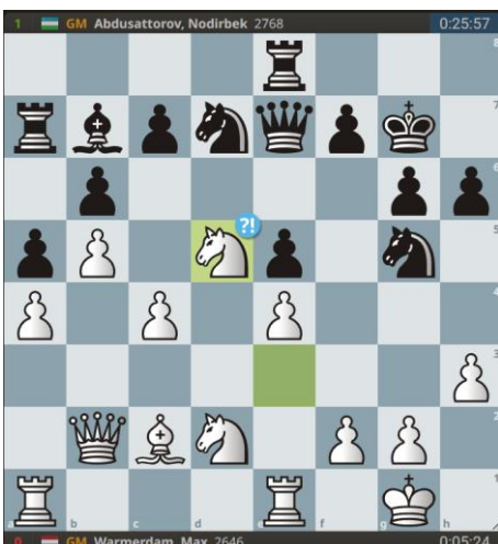
Dubbele aanval: veld-&baanruiming