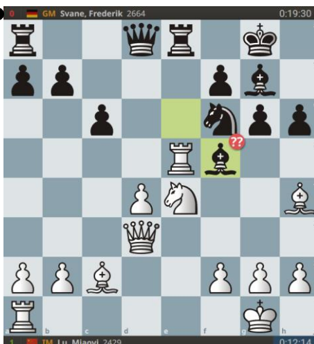
De zwarte dame is overbelast.