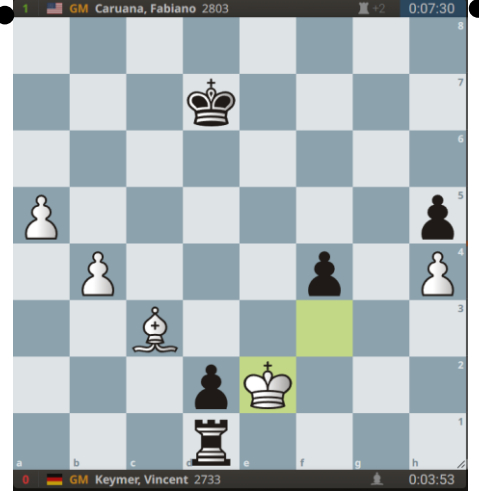
Maak het simpel af. Wat wil zwart?