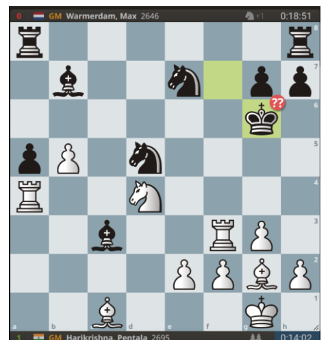
Profiteer met wit van P@d5 en K@g6